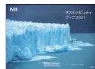
サステナビリティブック2021